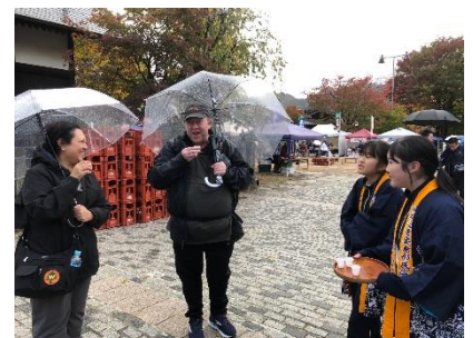
2年生「三蔵まいり」商品説明の様子

2年生は、職場体験後に、再び働かせていただく「職場体験リターンズ」やイベント・行事にボランティアとして参加する「地域貢献活動」に取り組んでいます。11月3日（月祝）、まつり広場では「三蔵まいり」が、8日（土）、文化交流センターでは「はいからマルシェ」が開催されました。どちらも主催者から、中学生に参加依頼があったもので、3年生と共に大活躍しました。「三蔵まいり」は、物品販売のお手伝いやまつり会館ガイドなど、多くの観光客に対して、丁寧な言葉遣いや態度で「おもてなし」ができました。「マルシェ」では、幼児や園児、小学生に「楽しんでもらおう」という思いやりの姿勢がたくさん見られ、イベントの後片付けまでやり切り、主催者から「ありがとう。助かりました。」「来年もお願いします。」とお言葉をいただきました。