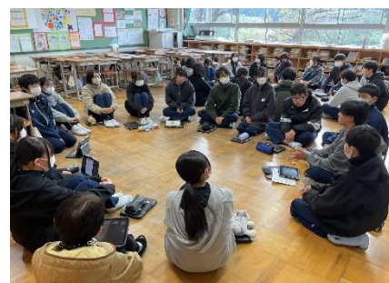
「ひびきあい集会」（カラートーク）

10月に行った「人権アンケート」をもとに、人権道徳①は、「私のいもうと」を題材とし、いじめの悲惨さと「傍観者がいること」がいじめを助長していることと、命をうばってしまうことにつながることを理解しました。「傍観者ゼロ」・「ありがとうであふれる古中」に向けて、各自・各学級が強い決意で「人権週間」を迎えました。