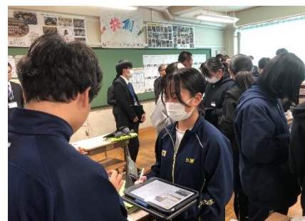
「授業中の意見交流」

古川中学校では、誰もが自分と仲間の心と身体を大切に、あったかい人間関係を創り上げることで、安心・安全に学校生活を送ることができるよう、毎日の授業や学校行事、諸活動を進めています。今月（11月）は、7月の「人権週間」に引き続き、「傍観者ゼロ、ありがとうがあふれる古川中」をスローガンとして、「ひびきあい活動」を行い、学校全体で人権感覚をより高める取組を実施しました。