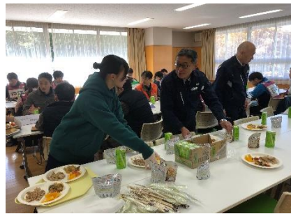
防災食の運搬を手伝う