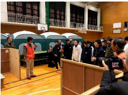
パーティションの説明を受ける