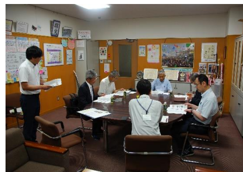
6/26「第1回校区会役員会」の様子

なお、校区会では、古川・河合・宮川地域のすべての世帯の方にご協力をお願いし、皆様からいただいたご厚意(一世帯 400 円)を生徒(学校)の様々な活動や環境整備等にに使わせていただいております。おかげ様で、よりよい環境の中で充実した活動を行うことができています。誠にありがとうございます。以下、校区会でご援助いただいた主なものを報告させていただきます。