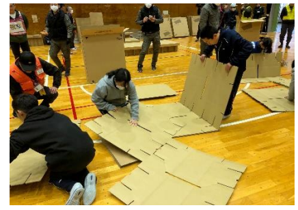
段ボールベッドを組み立てる

生徒たちは、前期に学んだ防災の知識・技能を活かし、災害が起きた際に「やらなければならないこと」等を本物に近い形で体験しました。今後、予測できない災害に対して、生徒が防災を自分事として、地域の一員として避難所運営等に関わることができるよう、地域人としての活躍を期待しています。なお、訓練には、吉城高と飛騨神岡高の高校生がグループリーダーとして参加し、地元24区の区長さんをはじめ住民の皆様を各ブースに案内しました。本校2年生6名も、昨年度の設営訓練の経験を活かし、各ブースの補助等、様々な仕事を積極的に行いました。（12月、生徒たちは、「防災マイプロアウトプット」を各保育園や小学校、高齢者施設で行う予定です。）