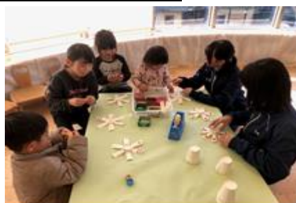
「思い出の絵本展」（市図書館）

今年度も行事や集会等で、「 中学3年間は、あっという間に過ぎていく。そんな大切な時間に、人を下に見たり、差別したり、いじめたりする暇（時間）はない！ 」と話しています。学校では、毎日の活動の中で、仲間との関わり合いを、地域（マイプロ）では、多くの方々とのふれあいを大切にしています。生徒たちが、こうした時間（場面）において、相手のことを考え思いやること、言葉遣いなど丁寧に対応することを実体験することで、いじめや差別をしない（許さない）という人権感覚を高め、強い心（レジリエンス）の育成につながると信じています。