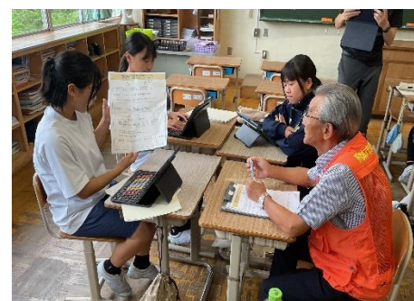
9/18 「防災マイプロ相談会」 防災士さんよりアドバイスをいただく

※11月15日（土）「避難所運営訓練」に、1年生生徒が参加します。（授業日扱い）