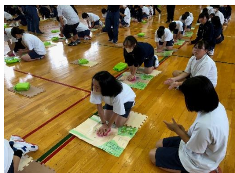
6/23 「ジュニアパラメディック」 2年生から「心肺蘇生法」を学ぶ

9月18日には、市防災士会の皆さんにご来校いただき、各チームの取組の様子や進度を見て、アドバイスをいただきました。どのチームもレベルアップできたようです。12月、多方面への「アウトプット」に向けて取組を継続していきます。