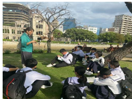
10/8 「碑めぐり研修」 平和学習講師の説明を真剣に聴く生徒