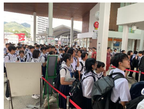
10/9 公共の場（宮島ローターナル）で、 フェリーへの乗船を待つ生徒たち