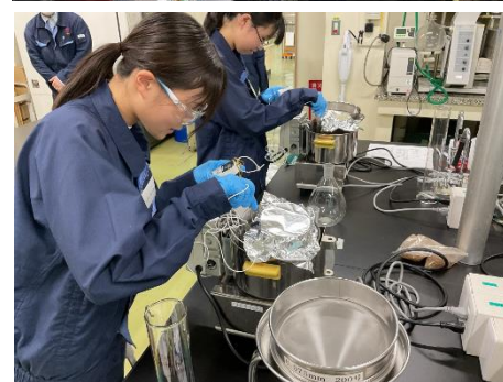
「職場体験」の様子 上：(株)ナウエ様、 中：味処古川様、下：(株)アルプス薬品様