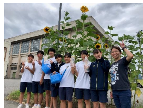
9/8「大輪のひまわり」を地域に発信！

通信やたより、HPによって、学校行事やマイプロ等、生徒の様子を紹介させていただいています。多くの方にご意見やご感想をいただき励みにもなっています。さらに、メール配信にもご理解ご協力いただいています。ありがとうございます。今後ともお願いいたします。