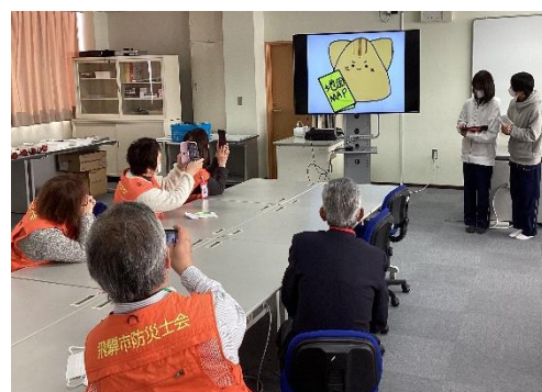
1/17「防災士会」の方々に取組成果発表

この地震は飛騨市にこれまでに無い大きな揺れをもたらしました。被災地と比較するならば、大きな被害もなく、私たちは変わらず生活できていることを感謝しなければなりません。そして、この機会に防災に関わる事項（身近な施設・設備の点検や日頃の備え、避難や連絡方法等）の再確認を行う必要があります。今こそ、地域や家庭、学校（小中学校での防災学習や命を守る訓練、1年防災マイプロ等）で学んだ知識を活かし、誰もが自分事として行動しなければなりません。