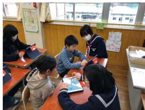
12/19 小学生への「学習支援」（古川西小）

古川西小学校から、高学年児童の「学習支援」の依頼がありました。8名の生徒が古川西小へ行き、小学校の先生と共に支援を行いました。小学生が分からない問題を優しく教えたり、プリントの丸付けをしてあげたり、「ミニ先生」のようでした。9月の職場体験が活かされました。