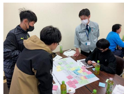
10/28「千代の松原公園づくり」のワークショップに参加

市役所都市整備課では、千代の松原公園の再整備にあたり、地域住民が参加する「公園づくりワークショップ」を開催しました。この意見交流の場に、中学生の参加依頼があり、2年生6名が参加しました。参加者の一人である地元の区長さんは、この様な場（大人と一緒に）で、自分の考えやアイデアを堂々と語る中学生にびっくりしてみえました。授業や行事での「表現力」が活かされたようですね。