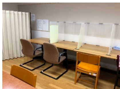
旧生徒懇談室（仮称：スタディールーム2）