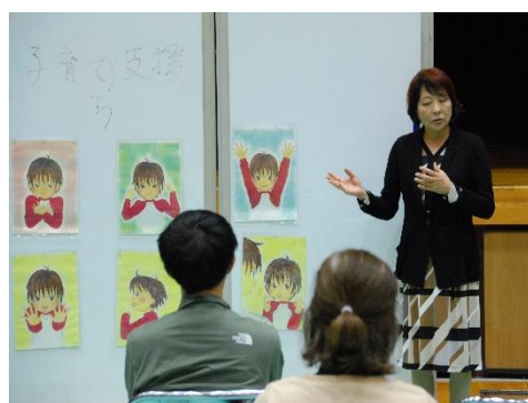
10/12「PTA子育て研修会」の一場面

体調不良を訴える生徒の多くは、十分な睡眠時間が確保されていません。その原因は、深夜までのスマホ・ゲーム等です。それは家庭学習にも影響しています。家庭と連携し、基本的な生活習慣の確立を指導し続けます。