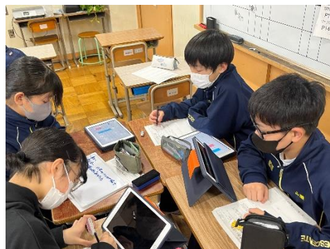
12/7「人権道德」学級のよさを出し合う

生徒会・委員会でのキャンペーンやレクリエーション、人権主任が企画した「ひびきあい活動（人権道德やアンケート等）」の取組によって、生徒たちの人権感覚が向上しました。