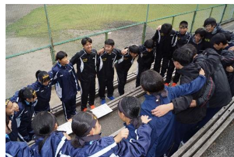
10/14 飛騨地区中体連駅伝大会 タスキと心をつないだ生徒たち

過去3年間は、コロナ禍の影響で、人との濃密接触を極力避けたことから、暴力行為等の件数は少なくなりました。その反面、メールやネットでの非難中傷といったケースは増加傾向にあります。その上で、下記の表1にあるいじめ認知件数「6件」は、例年と比較するならば「少ない」と言えますが、「ゼロ」ではありません。