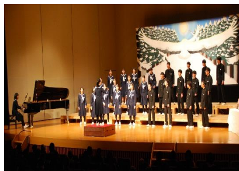
美術部作成「大パネル」前での合唱

古川中学校は、令和5年度「合唱祭」を12月15日（金）に、市文化交流センター「スピリットガーデンホール」で開催しました。インフルエンザ流行のため開催を2週間延期しましたが、多くの保護者・関係者の皆様にご来場いただき、生徒たちの美しいハーモニーを堪能していただきました。ご参観、そして、温かいメッセージもいただき、本当にありがとうございました。