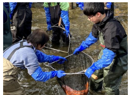
4/6「瀬戸川コイの引っ越し」

これまで地域・企業・行政の皆様にお世話になりました「古川中マイプロ」を、今年度も全校生徒（1年防災、2年職業、3年地域貢献）が取り組みます。すでに、「瀬戸川コイの引っ越し」等、一部取組が始まっています。入学式で都竹市長さんより「古川中は課題解決学習において全国でもトップを走っている！」と力強いお褒めと励ましのお言葉をいただきました。「地域人」「未来人」として、生徒たちの取組にご期待下さい。