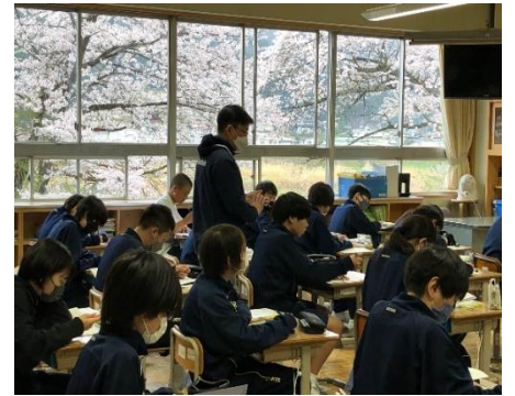
満開の桜を背景に授業がスタート!!

4月9日（火）入学式、古川中学校は新入生138名を迎え、全校生徒379名、教職員51名で、令和6年度を力強くスタートしました。生徒一人一人が授業や行事、学校内外の活動において、様々な人々と関わり、「たくさん学ぶ」「自ら考え行動する」「何かに挑戦する」という体験を積み重ね、「自分らしさ」を見つけ、輝かせる1年となるよう努めてまいります。保護者・ご家庭、地域の皆様の温かいご支援をお願い申し上げます。