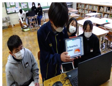
新港國民中生徒に日本食を説明する生徒 （2年生：新港國中とのオンライン交流）

12月18日（水）、第2回協議会では、2年生「台湾新港國民中学校とのオンライン交流」の様子を参観していただき、給食の試食、その後、学校教育活動へのご意見をいただきました。学校からは、今年度の1～3年生「マイプロ」について、委員の皆様のご支援に感謝申し上げ、引き続きのご支援をお願いしました。