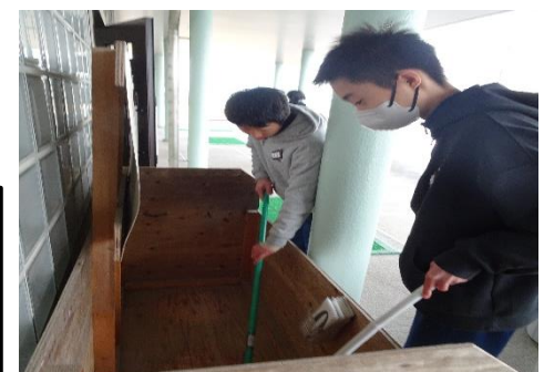
「縦割り掃除」 仲間と共に学校をきれいに!

こうした、他学年の仲間と共に思いや考えを伝え合うこと、「縦割り掃除」のように同じ目的に向かって活動すること、こうした体験が、多様な仲間と関わる力を高めるとともに、個々の表現力(やコミュニケーション力)を高めることにつながっています。