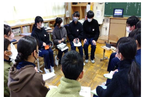
「ひびきあい集会」 仲間の声を大切に!

12月19日(木)、生徒会執行部と人権担当教諭が中心となり、「ひびきあい集会」を開催しました。「誰もが安心して笑顔で過ごすことのできる学校づくり」に向けて、これまでの成果や今後について意見を出し合いました。どの班も、誰もが安心して話せる(仲間を受け入れる)雰囲気を3年生中心に創り上げていました。