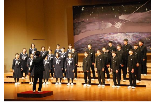
美術部作成「大パネル」前での合唱

12月5日(木)、市文化交流センター「スピリットガーデンホール」にて「合唱祭」を開催しました。コロナやインフルエンザの影響が心配されましたが、生徒たち、先生たちの頑張りで、予定通り実施できました。当日は、多くの保護者・関係者の皆様にご来場いただき、生徒たちの美しいハーモニーを堪能していただきました。温かい拍手やメッセージを沢山いただき、本当にありがとうございました。今後の励みとなります。