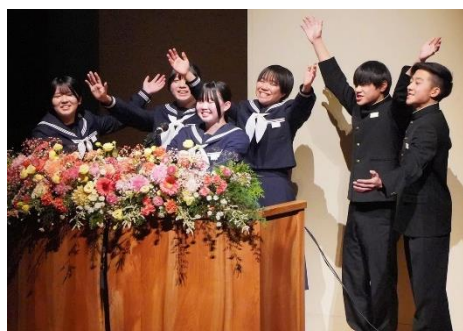
上：式典オープニング(飛騨市合同吹奏楽団) 下：3年生マイプロ「まちなみ研究会」発表