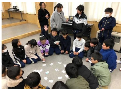
「防災マイプロ(防災かるた)」 古川小学校4～5年生に学びを発表

12月6日(金)から、1年生が学んだ「防災」の知識を自分の好きや得意を活かして保育園児や小学生、地域の方々に伝える取組がスタートしました。「防災」をいかに「自分事」として捉え、誰に、何を、どう伝えたいのかを考えました。紙芝居やタブレット動画等の作成、防災に関するゲームや遊びの企画、ダンボールベット等の具体物の製作等、それぞれのチームが創意工夫しました。自分の学びや思いをどう伝えるのか深く考え、実行するという貴重な体験になりました。