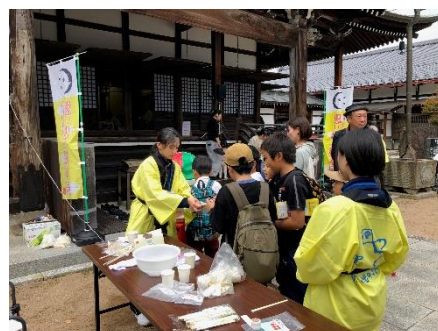
3年生マイプロ、活動の場の支援 （思い出の絵本展「縁日」in 円光寺）